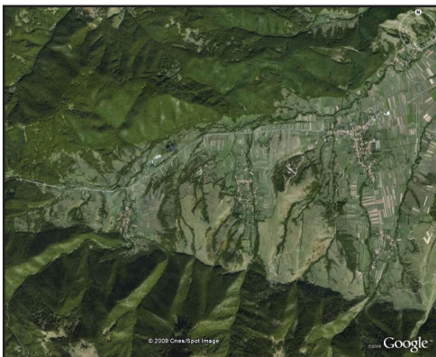
Văzut din satelit, peisajul României este încă verde...

Totodată, vrem să demonstrăm că această sarcină poate fi practic îndeplinită într-un timp relativ scurt și fără a se cheltui în acest sens sume exorbitante de bani, utilizând tehnica modernă.