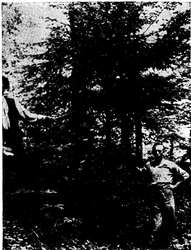
Fig. 2. — Exemplare de tisă pe valea Nehoiului, pe pârâul lui Stroe.

Aceste noi stațiuni se află în regiunea dealurilor.