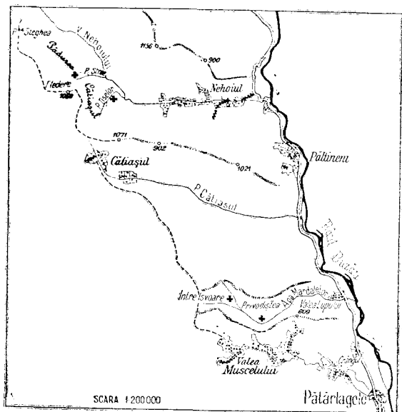
Fig. 4. — Schița de plan a regiunii cu stațiunile de tisă menționate în acest articol.

La punctul Privodiștea, de unde valea se deschide spre originea ei, pădurea este aproape complet dispărută, locul ei fiind luat de fânețe și terenuri de pășune. Aici se găsesc totuși vreo 10 tufe de tisă, de 2 m înălțime și 3—4 cm diametru. Trei dintre ele se află chiar pe vale,