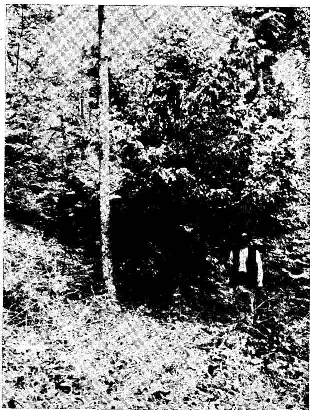
Fig. 3. — Exemplar de tisă pe pârâul lui Stroie în pădurea Cățiașul.

Pădurea Cățiașul se află pe partea dreaptă a văii, având o expoziție generală nordică. Altitudinea punctului cel mai de jos din această pădure este de 600 m pe Valea Nehoiului, iar creasta separatoare, dintre Valea Nehoiului și Valea Cățiașului are înălțimi cari pornesc dela 1000 m ca să culmineze la 1314 m în Poiana Steghea.