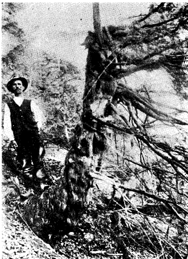
Cel mai gros exemplar de tisă din stațiunea Bonțul-Mic

1. Prima se găsește pe dreapta râului Buzău în muntele Jariștea în basinul larg deschis spre N. Est-Est al pârâului Bonțul Mic, cunoscut și sub numele de Bonțul Sec. Accesul este ușor. Se