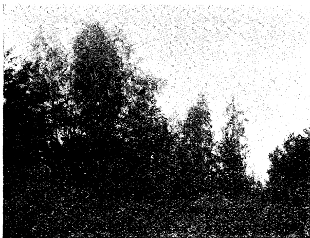
Fig. 4. — Ienuper în Poiana Nicovanului Abb. 4. — Wacholder in Poiana-Nicovanului