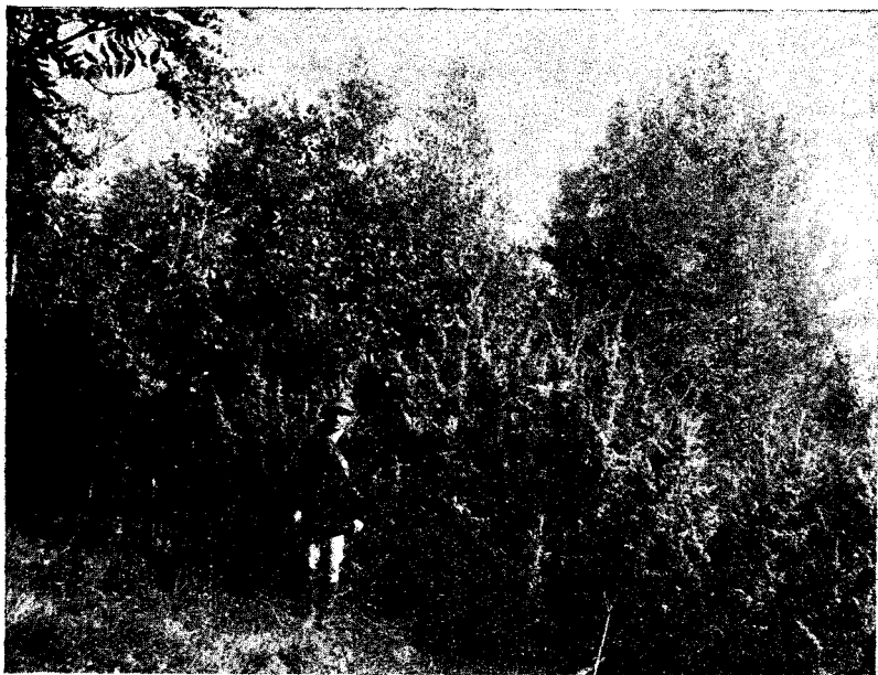
Fig. 3. — Ienuper în Poiana Nicovanului. Exemplarul cel mai mare Abb. 3. — Wacholder in Poiana-Nicovanu. Eines der grössten Exemplare

mijlocie a subzonei fagului (pe hartă însă limita ienuperului este trasată mai sus, de ex. pe Valea Buzăului cu mult mai sus de Cislău, destul