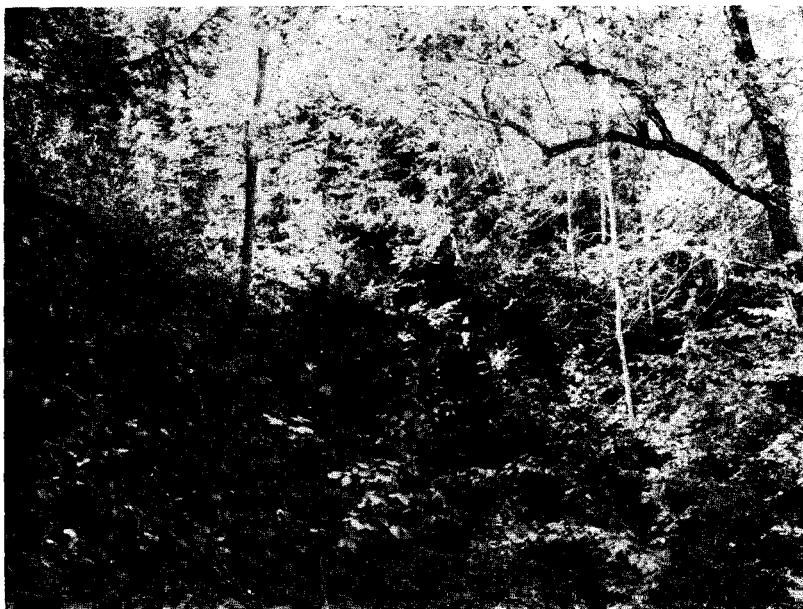
Fig. 1. — Coastă acoperită de tufăriș de Tisă. În colțul de sus, stânga, se văd crengile unui exemplar mai mare

Tisa crește ca subarboret pe o întindere de cca. 10 ha; este localizată mai ales pe valea principală, unde primul exemplar, un puet tânăr, l-am găsit la 504 m alt. Dela 425 m alt. începe tufărișul continuu, apărând și exemplarele mari, printre care terenul e acoperit cu pueți și lăstari tineri. Foarte multe exemplare, mai ales tineret, se ridică și