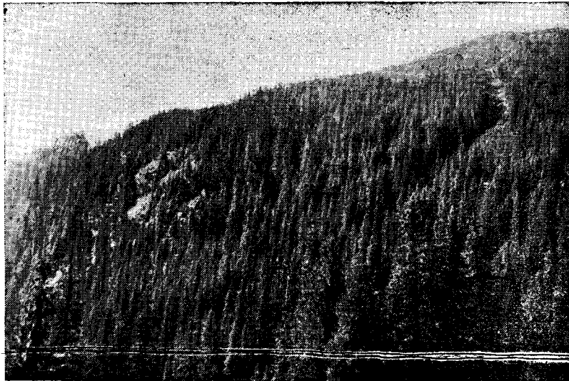
Fig. 2. — Vedere spre versantul drept, expus spre Est, al văii Vladului.

La Est de culmea secundară care leagă lanțul Făgărașului, de cel al Ezerului și Păpușii și între aceste două lanțuri, ia naștere râul Dâmbovița, care inițial curge în direcția SV-NE, pentru ca apoi, scăpând de înlănțuirea lor și de piedica pusă deacurmezișul de Piatra Craiului, să ia direcția aproape N-S cu o ușoară deviere spre SE.